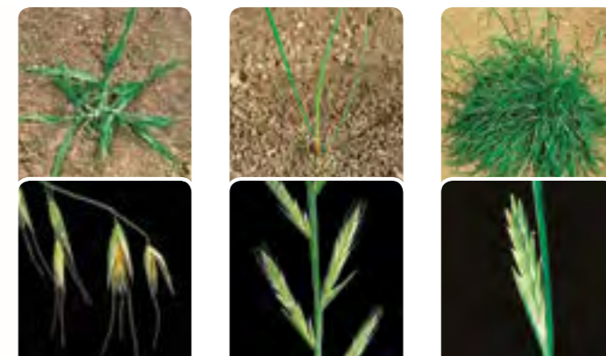
Avena ( Avena spp.)

ATLANTIS® FLEX controlla efficacemente tutte le principali infestanti graminacee, anche quelle di più difficile controllo come il bromo.