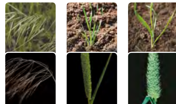
Bromus sterilis ( Bromus spp.) forasacco rosso