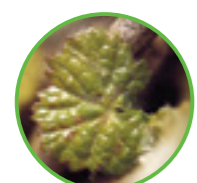
Cicaline e azione collaterale su cocciniglie e fillossera

marginale possono assumere nel tempo un ruolo maggiore. Differenti condizioni climatiche, inoltre, contribuiscono ad aumentare l'intensità degli attacchi e dei danni. Bayer offre una soluzione ad ogni problema.