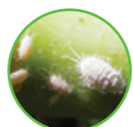
Cocciniglie e fillossera