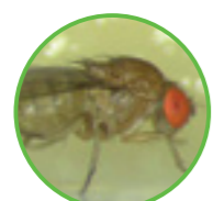
Drosophila suzuki , cicaline e lepidotteri